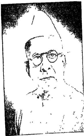
स्वर्गीय भाग वल्लभाकर सुन्दरलाल ठरसई पडवापट, अहमदाबाद